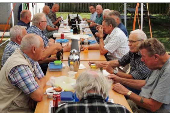
Frokost og gode soldaterhistorier.

Tak til Nykøbing afdelingen for værtskab og tilrettelægning af arrangementet.