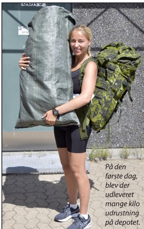
På den første dag, blev der udleveret mange kilo udrustning på depotet.

Tilbage i august måned mødte 67 unge kvinder og mænd til fire måneders basisuddannelse.