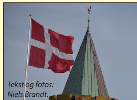
Tekst og fotos: Niels Brandt.

Efter den officielle del på torvet, marcherede soldaterne, fanekommandoerne og gæster til Vordingborg Kirke - Vor Frue Kirke - hvor sogne- og feltpræst