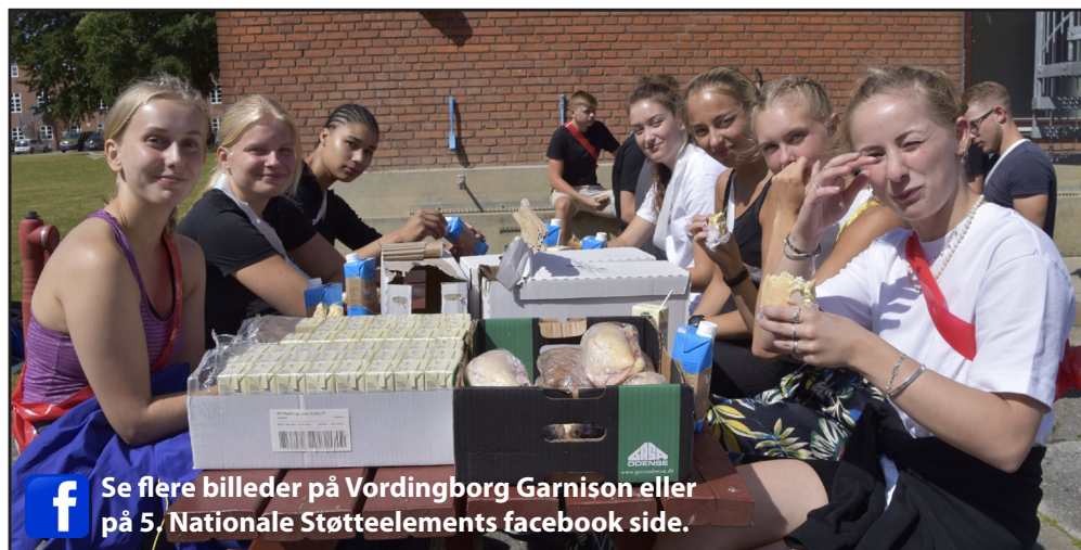
Se flere billeder på Vordingborg Garnison eller på 5. Nationale Støtteelements facebook side.

Samtidig har eller skal de træne i redningshjælp, brandbekæmpelse og førstehjælp. Desuden har de i en kortere