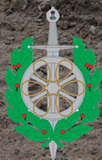
4. Nationale Støttebataljon/ Trænregimentet