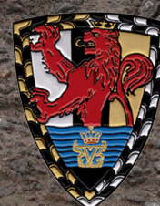
Falsterske Fodregiments Soldaterforening