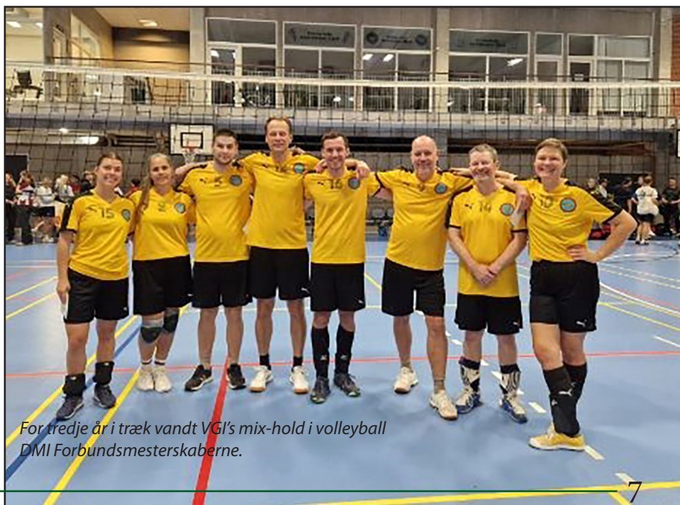
For tredje år i træk vandt VGI's mix-hold i volleyball DMI Forbundsmesterskaberne.

seniorer" flot finalen, hvor man dog måtte se sig besejret af Krigsveteranlandsholdet.