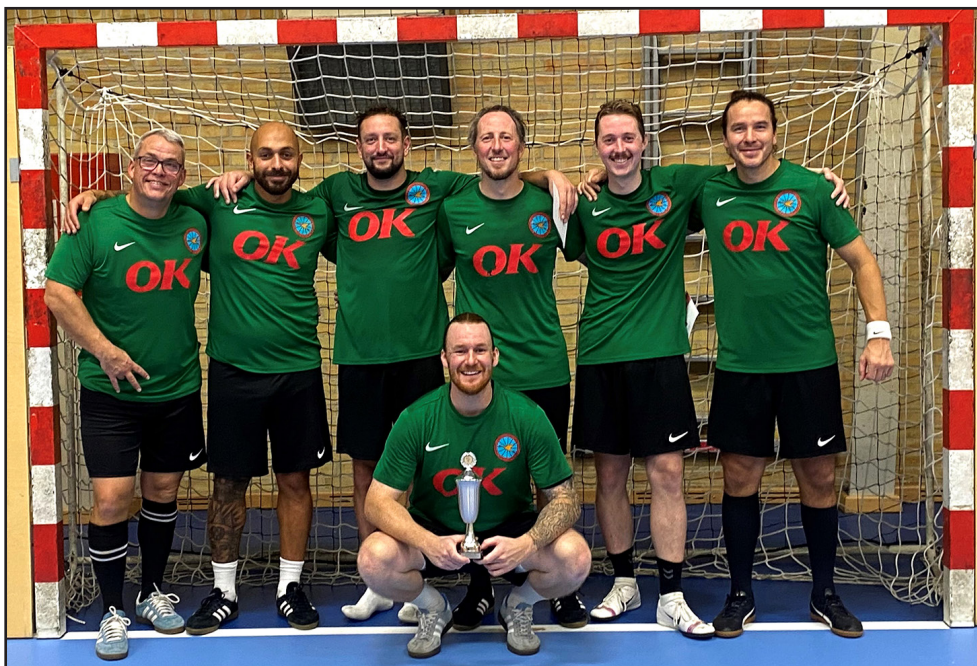
Forbundsmesterne i indendørs fodbold 2024 kommer fra Vordingborg Garnisons Idrætsforening - stort tillykke.

Fredag den 8. november 2024 blev en god dag for Vordingborg Garnisons Idrætsforening (VGI), da Dansk Militær Idrætsforening (DMI) og Fredericia Garnisons Idrætsforening afviklede DMI Forbundsmesterskaberne 2024 i indendørsfodbold og volleyball i Fredericia Idrætscenter.