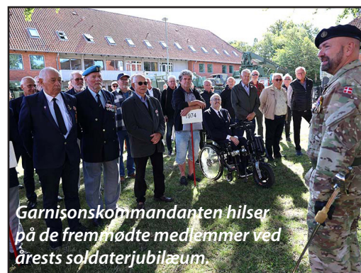
Garnisonskommandanten hilser på de fremmødte medlemmer ved årets soldaterjubilæum.

to årlige skydestævner. Her ligger ret præcist baggrunden for, at vi - 43 år efter vort regiments nedlæggelse - fortsat er i stand til at drive en soldaterforening med en trofast medlemsskare.