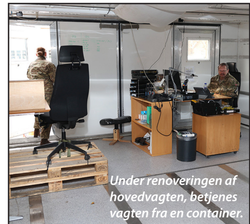
Under renoveringen af hovedvagten, betjenes vagten fra en container.

Derudover er der en række "trængende" småopgaver som nu endelig kan blive renoveret og udbedret.