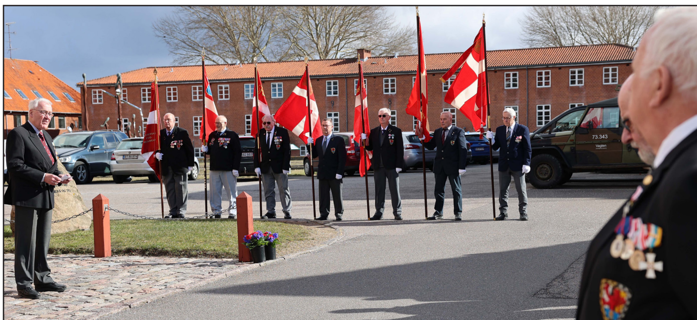
Markering af regimentets stiftelsesdag har gennem årene med markant tilslutning været et fast punkt i soldaterforeningens traditionspleje og i et fint samarbejde med garnisonen - og altid med vores regimentsfane på fløjen..!

I rumtildelingen på "museumsgangen" skabes også plads til et par depotrum til os, og det vil samlet set hen ad vejen betyde, at soldaterforeningen i processen helt forlader 2. sal i bygning Vejle og overlader disse lokaliteter til kasernens tjenstgørende personel. (forts. s.14).