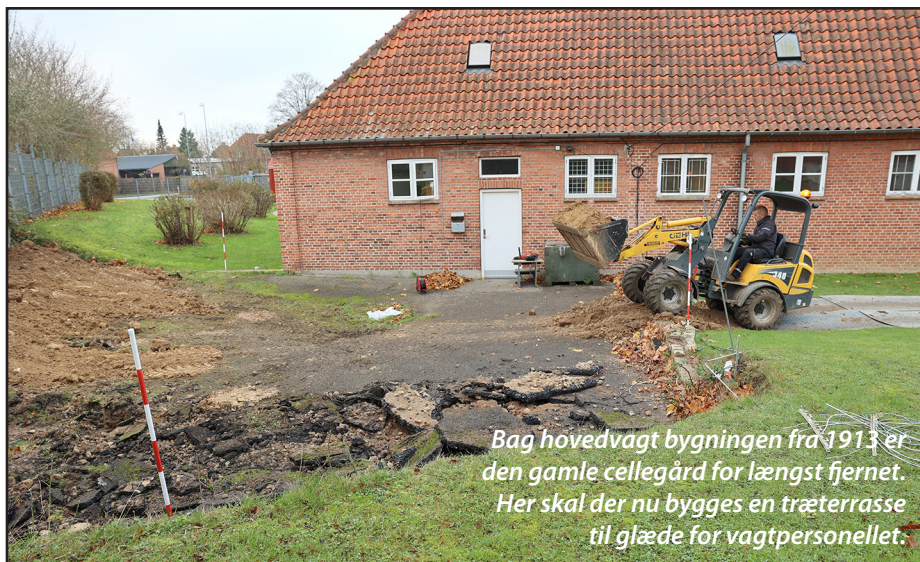
Bag hovedvagt bygningen fra 1913 er den gamle cellegård for længst fjernet. Her skal der nu bygges en træterrasse til glæde for vagtpersonellet.

Der har endvidere været møde med Forsvarsministeriets Ejendomsstyrelse om udarbejdelse af en ny helhedsplan for garnisonen. En sådan helhedsplan skal ses i sammenhæng med ovennævnte mandskabsbygning og forventede nye