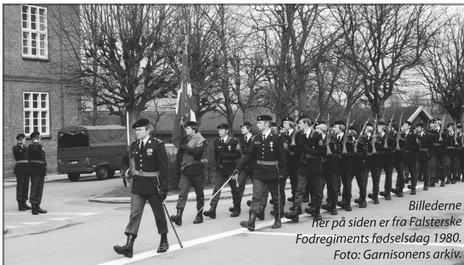
Billederne her på siden er fra Falsterske Fodregiments fødselsdag 1980.

En af soldaterforeningsbevægelsens markante og meget gamle landsforeninger - Kystartilleriforeningen - besluttede at indstille sit aktive virke ved udgangen af 2021 efter mere end 100 års aktiviteter. Kystartilleriforeningen var stiftet i 1909.