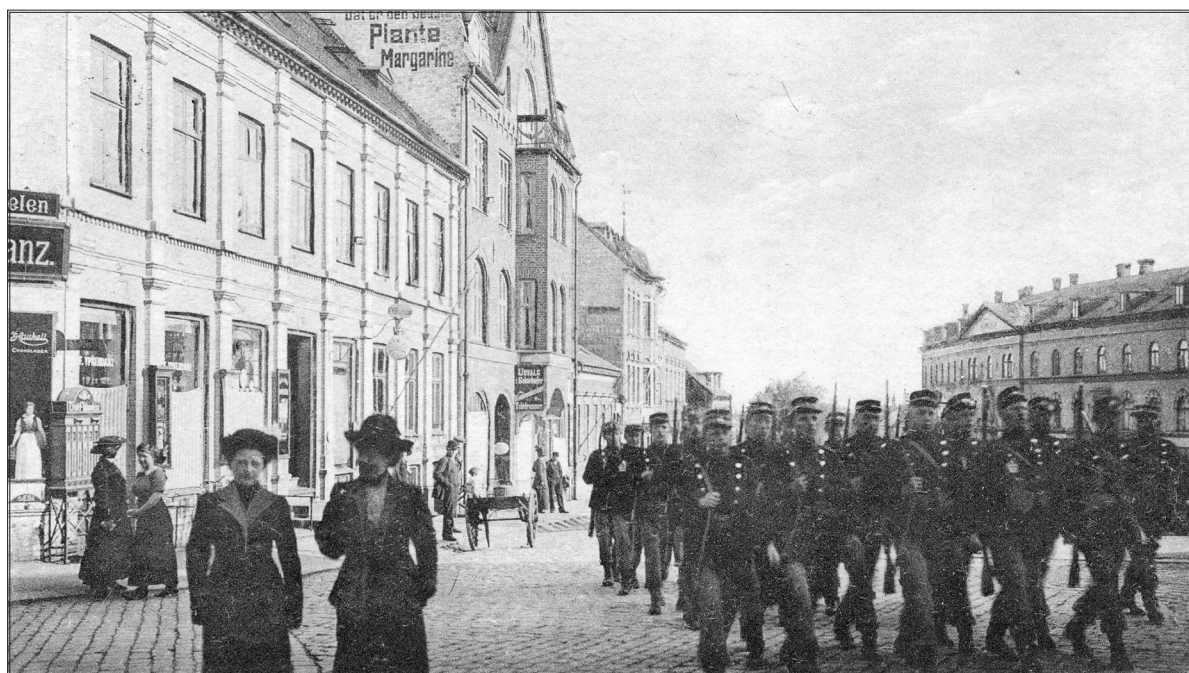
Schweitzerpladsen i Slagelse. Billederne i dette indlæg er gode illustrationer fra 14 Bataillons virke i Slagelse Garnison.