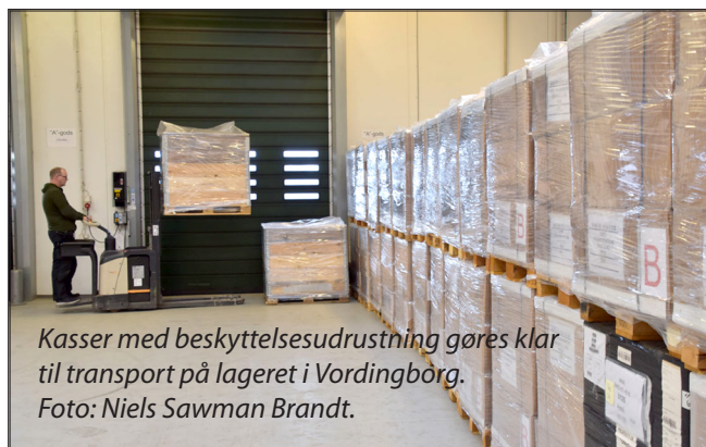
Kasser med beskyttelsesudrustning gøres klar til transport på lageret i Vordingborg.

Ukraine anmodede om en donation af beskyttelsesudrustninger. Regeringen besluttede derfor at donere materiel fra Forsvaret til Ukraine. Der blev doneret 2.000 sæt beskyttelsesudrustninger - de såkaldte TYR-beskyttelsesudrustninger - samt 700 sanitetstaskers varets opgaveløsning og soldater. Kilde: FKO.