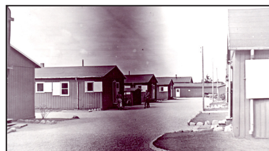
Udover "Elefantbygningerne" var der i 1946 ligeledes indkvartering i "Minkfarmen", der lå bag depotbygningerne. "Minkfarmen" blev opført umiddelbart efter 2. Verdenskrig og fjernet i 1958.

NB. Rationeringskort for Dagen medbringes.