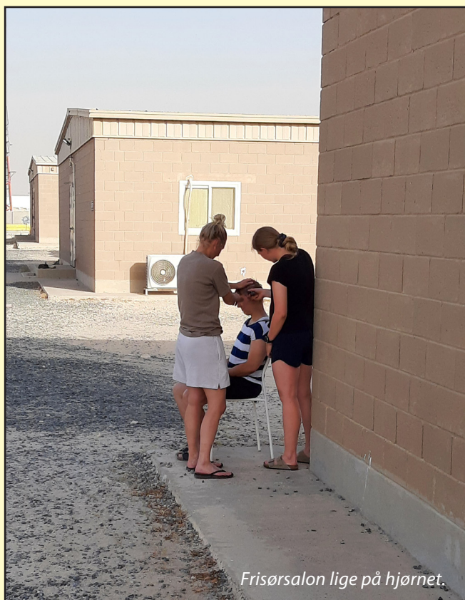
Frisørsalon lige på hjørnet.

tider kunne være svære at gennemskue. Vi fik derfor stejl læringskurve i kuwaitisk kultur, men også i den amerikanske kultur med at optimere opgaveløsningen og kommunikationen med dem.