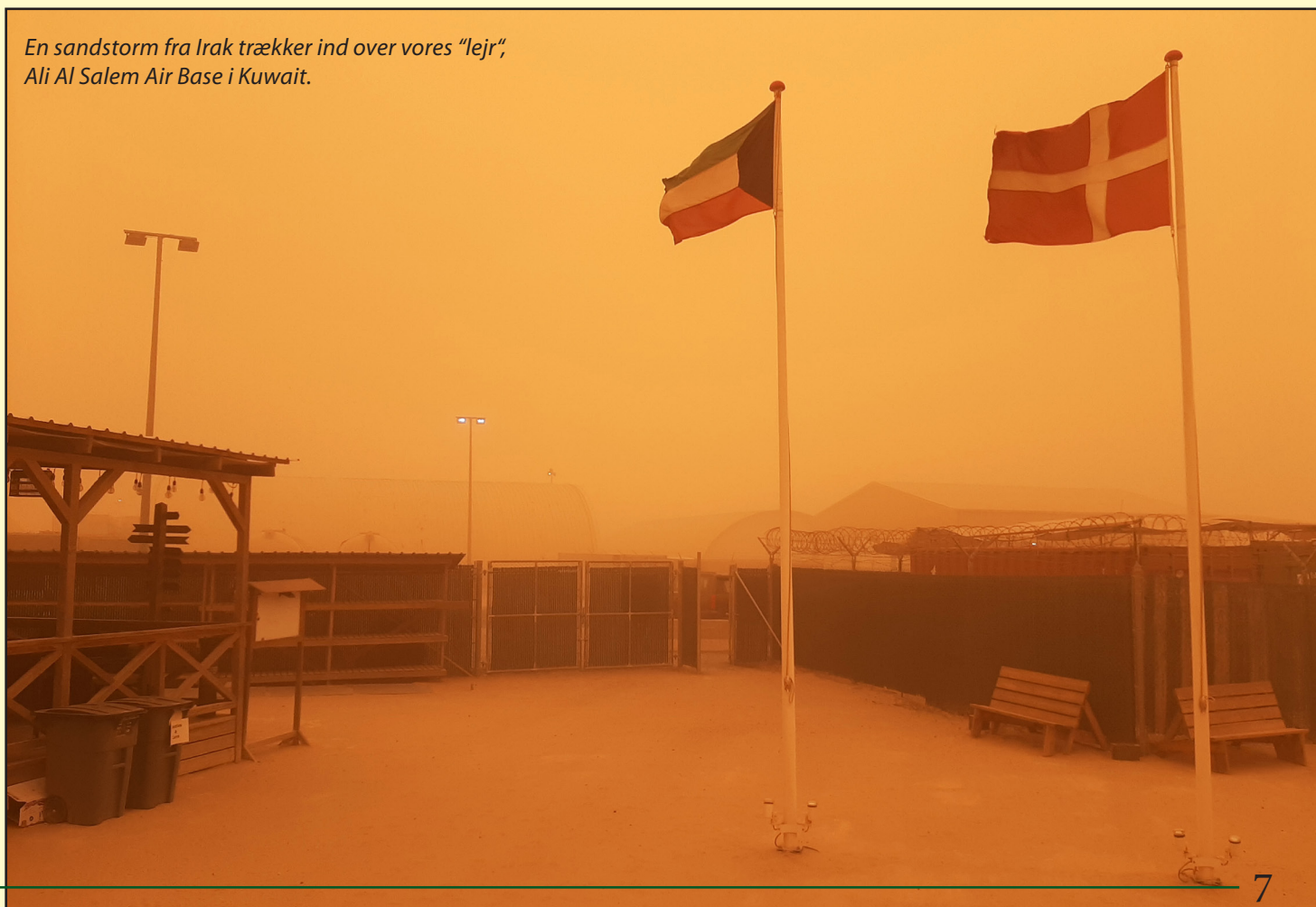
En sandstorm fra Irak trækker ind over vores “lejr”, Ali Al Salem Air Base i Kuwait.

Samtidig skulle vi søge diverse tilladelser i det Kuwaitiske statsapparat, der til