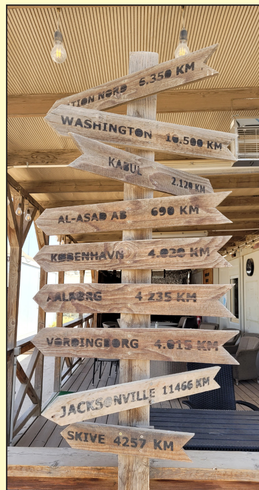
Alle veje fører til...

De forskellige opgaver under missionen betød, at stort set alle fra NSE, enten nåede at komme en tur til Irak eller Qatar, og derved få lidt luft under vingerne, og fik set andet end Kuwait og Ali Al Salem Air Base. For mit eget vedkommende var det en stor oplevelse at komme til Irak, især de første gange, hvor jeg var så heldig at flyve med "Black Hawk" fra og over Bagdad til Al Asad Air Base.