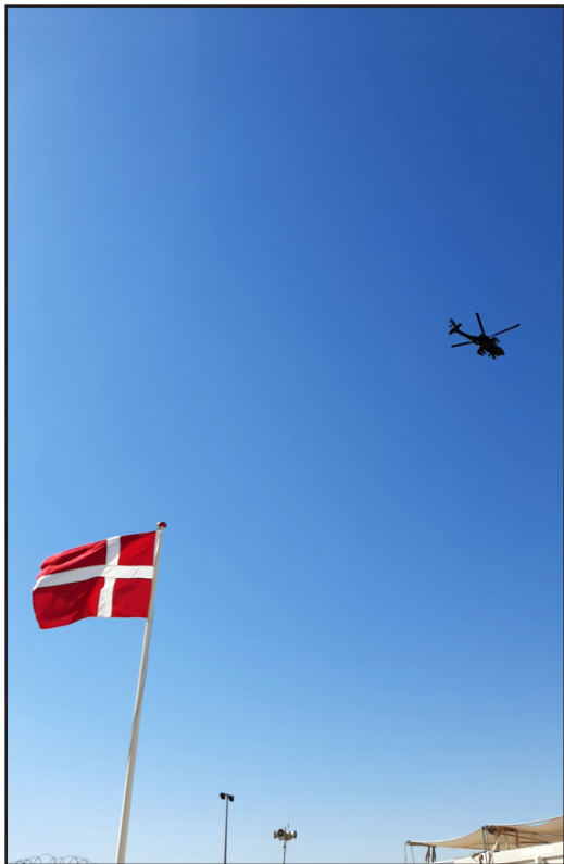
Helikopter med en flot blå himmel over Ali Al Salem Air Base i Kuwait.