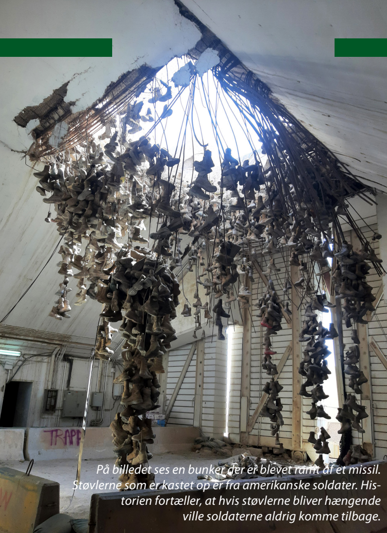
På billedet ses en bunker der er blevet ramt af et missil. Støvlerne som er kastet op er fra amerikanske soldater. Historien fortæller, at hvis støvlerne bliver hængende ville soldaterne aldrig komme tilbage.

tider kunne være svære at gennemskue. Vi fik derfor stejl læringskurve i kuwaitisk kultur, men også i den amerikanske kultur med at optimere opgaveløsningen og kommunikationen med dem.