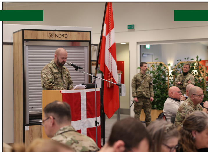
Garnisonskommandanten holder sin fødselsdagstale i kantine.