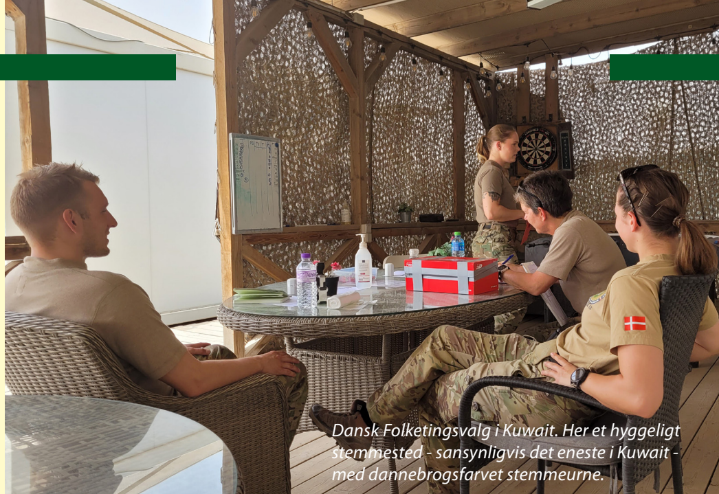
Dansk Folketingsvalg i Kuwait. Her et hyggeligt stemmested - sandsynligvis det eneste i Kuwait - med dannebrogfarvet stemmeurne.

Før vores afgang fra Danmark var der identificeret en række opgaver, der skulle løses under vores hold. På det tidspunkt roterede Nato Mission Iraq