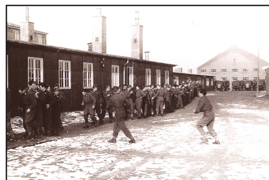
På billedet barakbygningerne "Buchenswald", der dog først blev opført i 1949. Bygningerne lå i det nuværende Generalens Gård.

De værnepligtige på billedet fra 1950 står i kø til spisebarakken - bygning 36.