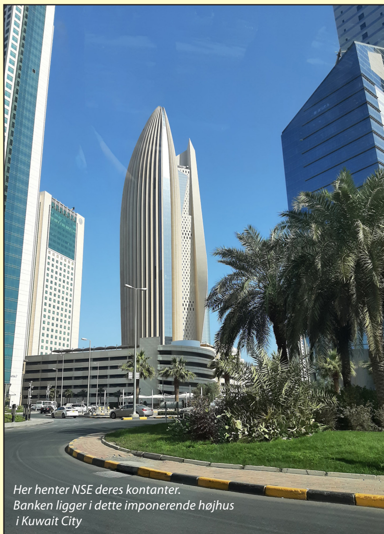
Her henter NSE deres kontanter. Banken ligger i dette imponerende højhus i Kuwait City

Det var altså et sammensat hold, men de fleste fra 4 NSBTN samt dem "udefra" havde erfaringer fra tidligere missioner,