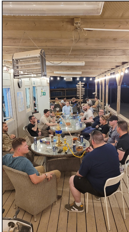
Fredagsstemning på verandagen sammen med samarbejdspartnere.