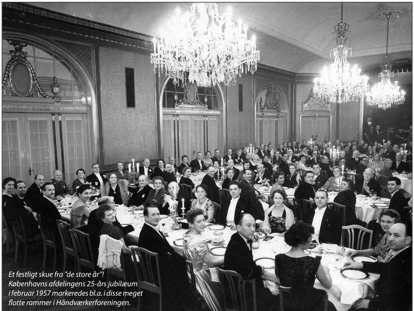
Et festligt skue fra "de store år"! Københavns afdelingens 25-års jubilæum i februar 1957 markeredes bl.a. i disse meget flotte rammer i Håndværkerforeningen.

I vore fire lokalafdelinger i soldaterforeningen fastholder 414 medlemmer med