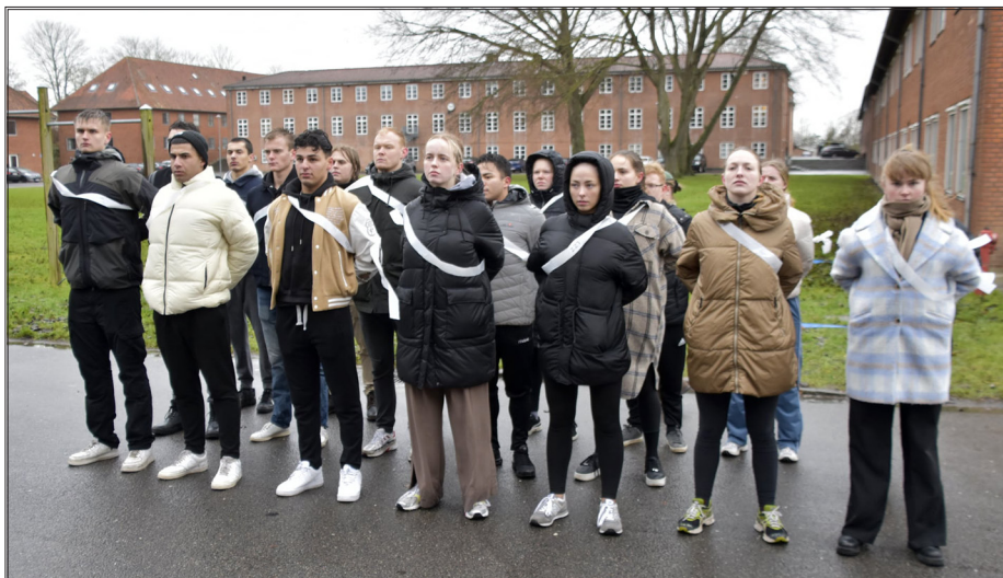
På første dagen blev der indøvet eksercits. Det er ikke så nemt endda: "Tænk at det kan være så svært at gå, stå og gøre omkring".

Igennem de seneste mange år har der været en stigende interesse hos de unge for at lære mere om Forsvaret og Beredskabsstyrelsen gennem værnepligten, så næsten samtlige unge, der trækker i uniform, gør det af egen fri vilje.