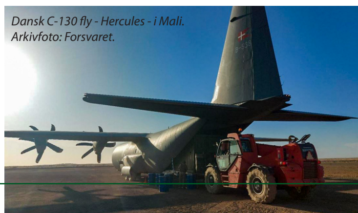
Dansk C-130 fly - Hercules - i Mali.

Det var planen at støtteelementet skulle opholde sig i Mali i seks måneder. Men den 27. januar besluttede den danske regering at hjemtage det danske bidrag. Hjemtagning af mandskab og materiel forventes at tage flere uger.