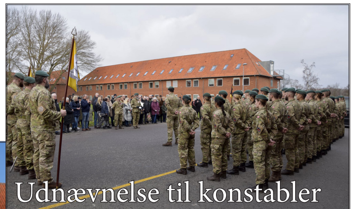
Udnævnelse til konstabler

"15 konstabelelever, som siden den 1. juni sidste år har gennemført Hærens Reaktionsstyrke Uddannelse (HRU), blev ved en parade den 31. januar udnævnt til konstabler".