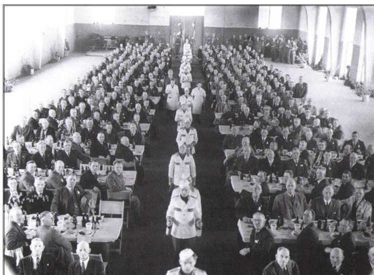
Jubilæumsfrokost i 1949 i Eksercerhuset.